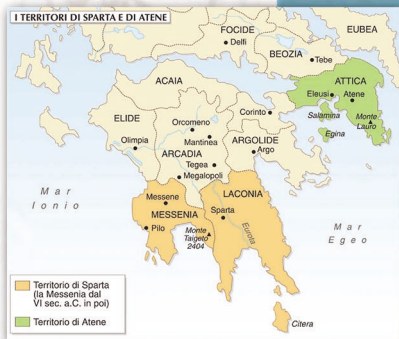
Il territorio di Sparta e la Messenia dal VI sec. a.C., da A. Righi, Gli Spartani (Venezia 2009).

Lastly, a panel of five ephoroi , in charge of making laws respected and having relevant juridical powers, counterbalanced the power of the gherosia and the kings.