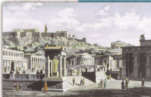
Ricostruzione del mercato di Atene con l'Acropoli sullo sfondo, di J. Buhlmann 1879, da Storia della Grecia Antica (2008).

such as Archonship, and being members of the Areopagus; conversely, thetes (last census class), could not access to any political office. All citizens (other than slaves, foreigners and women) had the right to vote .