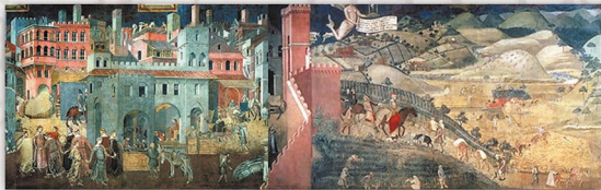
Siena, Palazzo Pubblico, Ambrogio Lorenzetti. Il Buon Governo , 1338 - 1339.

che gradualmente assunsero la forma di entità autonome, dotate di propri sistemi di amministrazione, tassazione e difesa; la vita economica e la partecipazione civica comunali erano animate da associazioni e corporazioni .