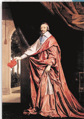
Londra, National Gallery, Ritratto del Cardinale Richelieu, 1640, di Philippe de Champaigne (1602-1674).