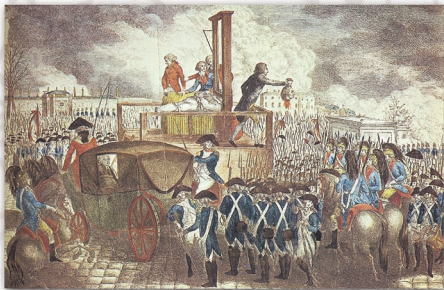
La Rivoluzione francese, morte di Luigi XVI.

Tra i documenti che sanciscono i diritti dei cittadini figurano l' English Bill of Rights (1689) e la Dichiarazione di Indipendenza americana del 4 luglio 1776. In Francia, nel 1789 viene emanata la Dichiarazione dei Diritti dell'Uomo e del Cittadino , mentre la Costituzione del 1791 , che costituisce la prima norma esplicita in materia di cittadinanza, conferma lo ius soli . Il Codice napoleonico del 1804 introduce invece la predominanza dello ius sanguinis , secondo il quale è cittadino francese chi è figlio di padre francese, a prescindere dal luogo di nascita.