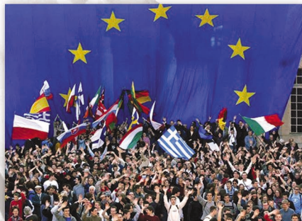
Il Parlamento per un'Europa sociale e sana, Politica dell'occupazione, 18 marzo 2008, da www.europarl.europa.eu/ .

the constitutions of all Member States; rights reserved for citizens of the Union; economic and social rights; including third generation rights such as the protection of personal data or the prohibition of eugenics.