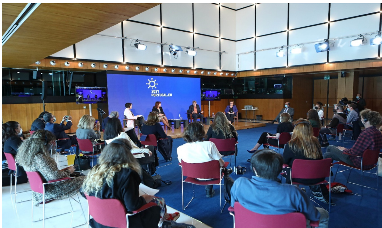
Evento dei cittadini europei, Lisbona

Gli altri membri del comitato esecutivo sono stati invitati a partecipare a distanza. L'evento è stato trasmesso pubblicamente sulla piattaforma digitale multilingue e su Europe by Satellite.