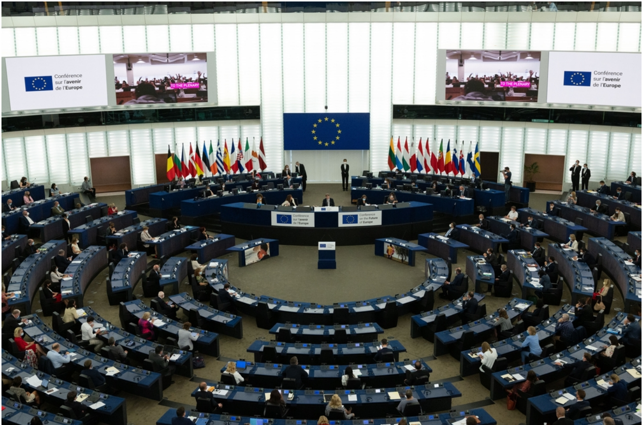
Sessione plenaria inaugurale della Conferenza, emiciclo del Parlamento europeo, Strasburgo

La sessione plenaria inaugurale della Conferenza sul futuro dell'Europa, alla quale hanno partecipato 377 membri, si è svolta in formato ibrido (in presenza e online) il 19 giugno 2021.