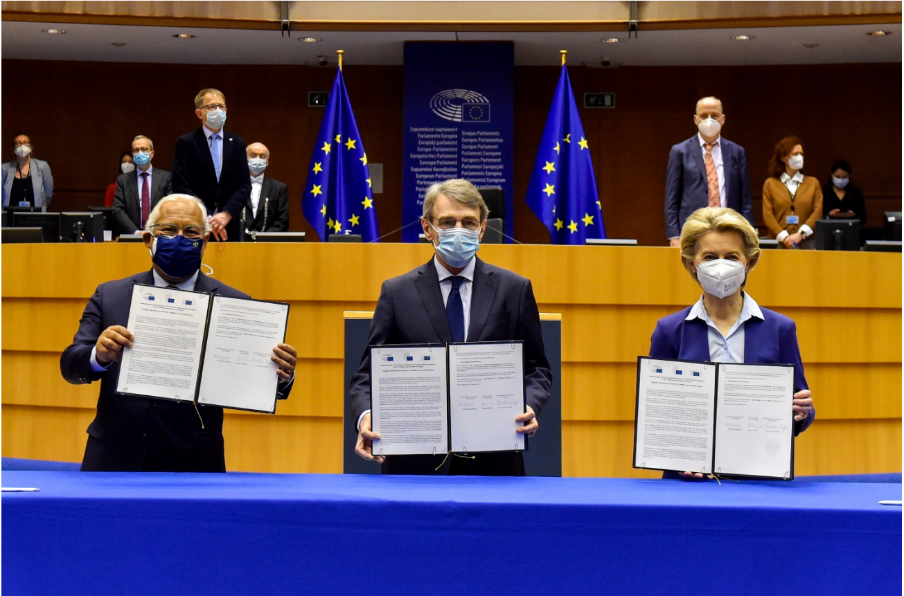
Da sinistra a destra: firma della dichiarazione comune da parte del primo ministro portoghese Costa, del presidente del Parlamento europeo Sassoli e della presidente della Commissione von der Leyen

La Conferenza sul futuro dell'Europa è sulla buona strada – il dibattito è iniziato! Il 10 marzo 2021 la firma della dichiarazione comune sulla Conferenza sul futuro dell'Europa da parte del presidente del Parlamento europeo David Sassoli, del primo ministro portoghese António Costa, a nome della presidenza del Consiglio dell'UE, e della presidente della Commissione Ursula von der Leyen, ha aperto la strada a questo esercizio democratico europeo senza precedenti, aperto e inclusivo, incentrato proprio sui cittadini. Appena due settimane più tardi il comitato esecutivo, che comprende rappresentanti delle tre istituzioni dell'UE e osservatori e sovrintende all'organizzazione della Conferenza, ha tenuto la prima riunione. Anche il segretariato comune che assiste il comitato esecutivo ha iniziato i lavori.