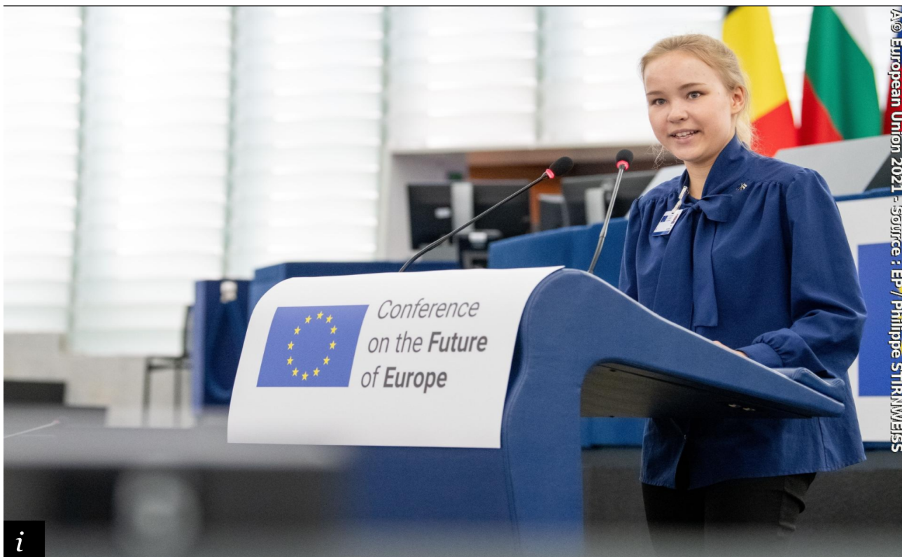
Rappresentante di eventi/panel nazionali della Finlandia alla sessione plenaria inaugurale della Conferenza