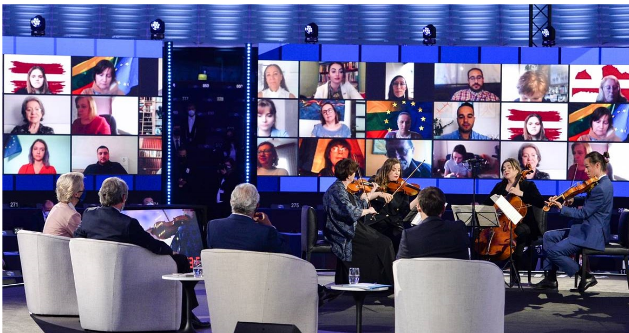
Da sinistra a destra: la presidente della Commissione von der Leyen, il presidente del Parlamento europeo Sassoli, il primo ministro portoghese Costa e il presidente francese Macron all'evento inaugurale della Conferenza

Prima dell'evento il comitato esecutivo ha approvato il regolamento interno della Conferenza , che fornisce un quadro completo per il lavoro delle varie strutture della Conferenza e la loro interazione.