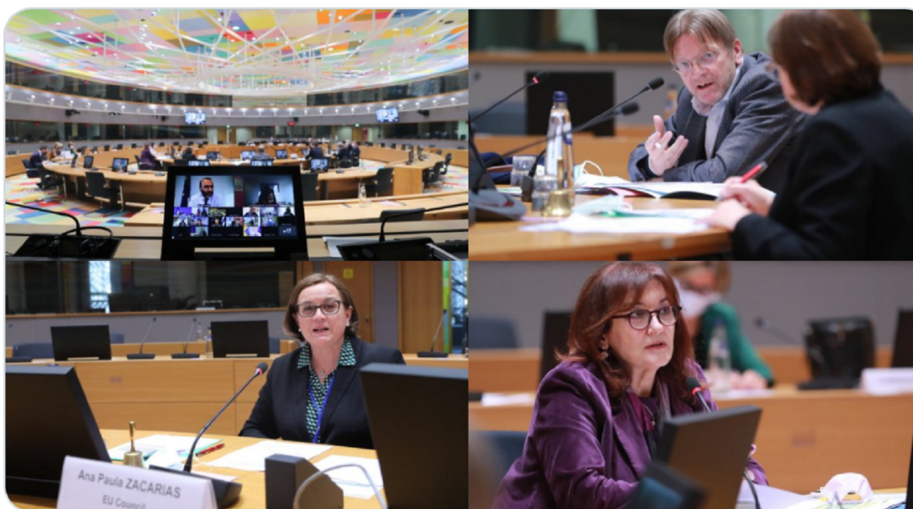
I copresidenti alla riunione del comitato esecutivo, sede del Consiglio, Bruxelles

Nella quinta riunione del 26 maggio il comitato esecutivo ha approvato il calendario provvisorio delle sessioni plenarie della Conferenza, dei panel europei di cittadini e dell'evento dei cittadini europei, nonché il progetto di ordine del giorno della sessione plenaria inaugurale della Conferenza. Il comitato esecutivo ha inoltre proceduto a uno scambio di opinioni sull'organizzazione della sessione plenaria della Conferenza. È stato anche informato in merito ai preparativi per un evento dei cittadini europei previsto per il 17 giugno 2021 in Portogallo, come pure all'aggiornamento delle modalità pratiche per i panel europei di cittadini e agli orientamenti per l'organizzazione dei panel nazionali di cittadini. Infine, il comitato esecutivo ha incaricato i servizi di comunicazione delle tre istituzioni di elaborare un piano coordinato per promuovere la Conferenza e in particolare la piattaforma digitale multilingue.