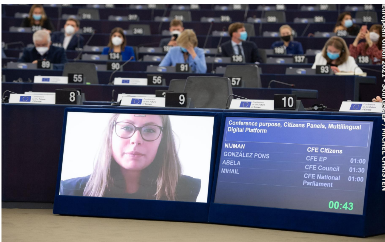
Rappresentante di eventi/panel nazionali dei Paesi Bassi alla sessione plenaria inaugurale della Conferenza